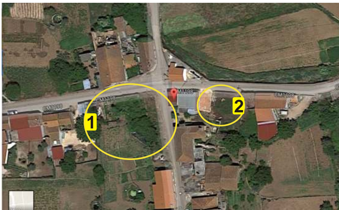
VISTA AÉREA DO CENTRO DA VENDA DAS FIGUEIRAS

É também necessário ampliar o espaço adjacente à sede construída pela Comissão de Festas para criar um espaço multiusos ao serviço da população não só na área cultural e recreativa, mas também em outras áreas dado a capacidade que estes espaços apresentam na facilidade de adaptação a várias necessidades..